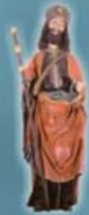
Der H. Jakob von Compostela Lithografie (Bilder um 1715/20) Isther Burgkapelle, Schloss Wolkersdorf um 1620 in Göttinger Stadt. 188 Göttinger - Museum im Kaiserhof

Die Pilgerreise ins spanische Santiago de Compostela gehört seit dem frühen Mittelalter zu den größten Wallfahrten des abendländischen Christentums. Millionen von Menschen legten in den vergangenen Jahrhunderten den Weg im Zeichen der Jakobsmuschel zurück, um am Grabe des Heiligen Jakob um Vergebung oder Gnade zu bitten. Besonders berühmt ist der Camino Frances, der von St. Jean-Pied-de-Port über 780 km bis nach Santiago de Compostela verläuft. Von Wien nach Santiago sind es 3200 km.