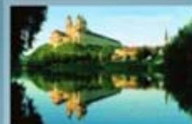
Markgraf Leopold I. machte die Burg in Melk zu seiner Residenz und seine Nachfolger stifteten sie mit wertvollen Schätzen und Reliquien aus. 1089 übergab Markgraf Leopold II. die Burg Benediktinermönchen aus Lambach. Seither leben und wirken hier bis heute in ununterbrochener Folge Mönche nach der Regel des Hl. Benedikt.

Von hier können wir auf einen wunderschönen, aber sicher auch anstrengenden Pilgerweg zurückblicken, zwischen den beiden barocken Klöstern Göttweig und Melk gelegen und inmitten des stillen, schönen und mystischen Dunkelsteinerwaldes.