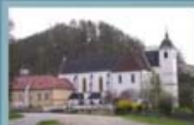
Die nach einer Krankenheilung 1605 errichtete Kapelle erfuhr durch den Zustrom der Gläubigen einen großzügigen Ausbau in der Barockzeit. Die Kirche „Maria - Heil der Kranken“ war bald zu einem viel besuchten Ort von Gebetsbittungen und Wunderheilungen geworden.