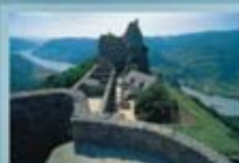
Die Burg wurde ursprünglich im frühen 12. Jahrhundert erbaut, im Zuge der Türkenbelagerung 1529 zerstört und in der Folge im Renaissancestil wiedererrichtet.

Der Pilgerweg führt an den „Sieben Gräbern“ (illyrisch-keltische Hügelgräber) und am „Roten Kreuz“, einem alten Bildstock vorbei, weiter zum Schoberstein und zum „Herrnplatzl“ (Weg Nr. 653). Wir gehen