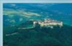
Die barocke Stiftsanlage wurde vom Architekten Johann Lucas von Hildebrandt erbaut, nachdem das alte Kloster durch einen Brand 1718 zerstört wurde.

Vom Stift Göttweig, dem österreichischen „Montecassino“, das 1083 vom Hl. Altmann, Bischof von Passau gegründet und 1094