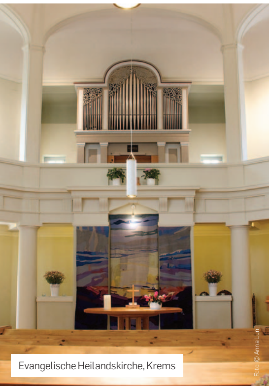
Evangelische Heilandskirche, Krems