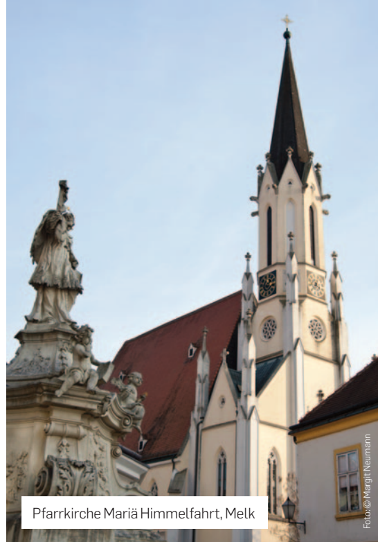
Pfarrkirche Mariä Himmelfahrt, Melk