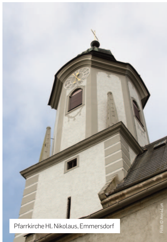
Pfarrkirche Hl. Nikolaus, Emmersdorf