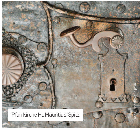
Pfarrkirche Hl. Mauritius, Spitz