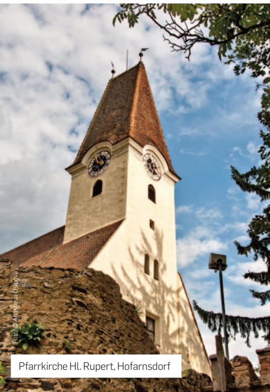
Pfarrkirche Hl. Rupert, Hofarnsdorf