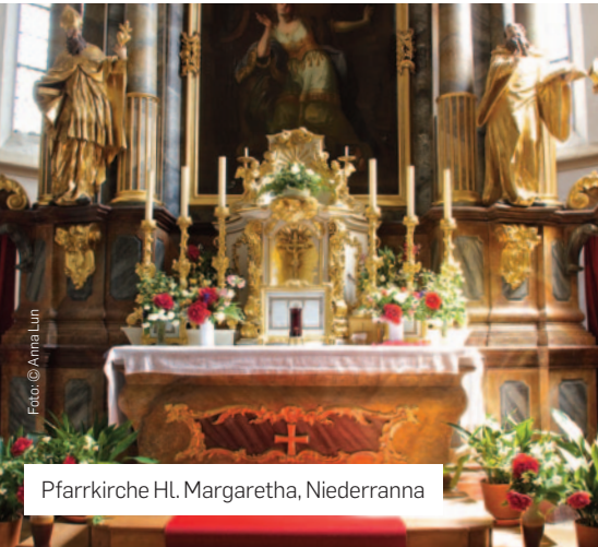
Pfarrkirche Hl. Margaretha, Niederranna

Ganzjährig tagsüber geöffnet. Führungen nach Voranmeldung bei der Pfarre Maria Laach +43 2712 83 39.