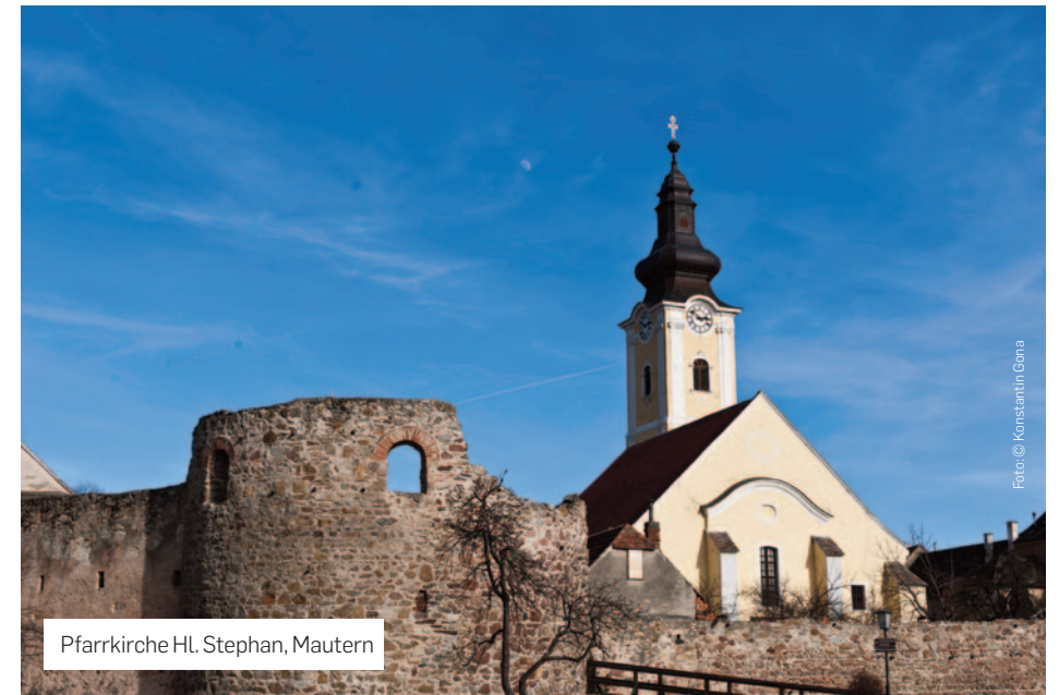
Pfarrkirche Hl. Stephan, Mautern