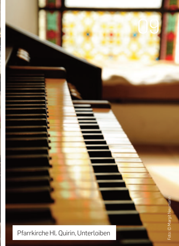
Pfarrkirche Hl. Quirin, Unterloiben