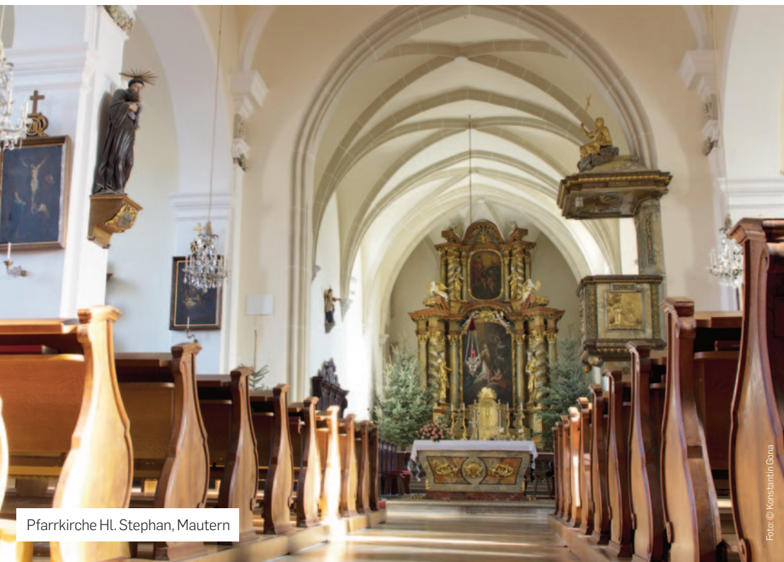
Pfarrkirche Hl. Stephan, Mautern