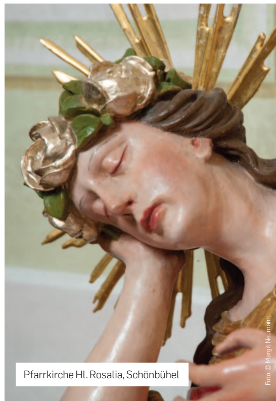
Pfarrkirche Hl. Rosalia, Schönbühel