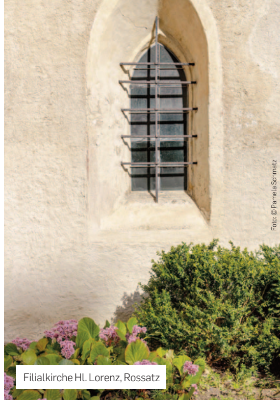
Filialkirche Hl. Lorenz, Rossatz