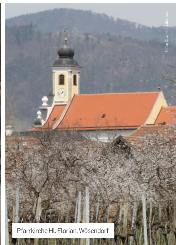
Pfarrkirche Hl. Florian, Wösendorf