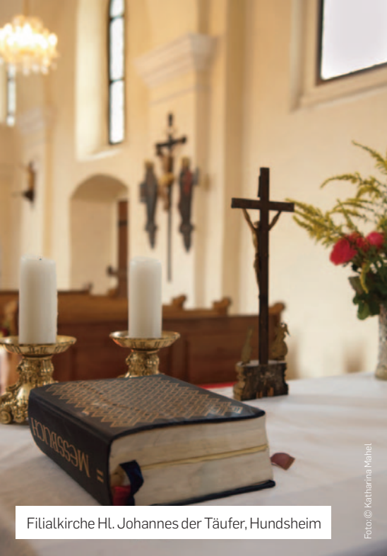
Filialkirche Hl. Johannes der Täufer, Hundstheim

Führungen auf Anfrage bei der Pfarre Mautern +43 2732 829 23.