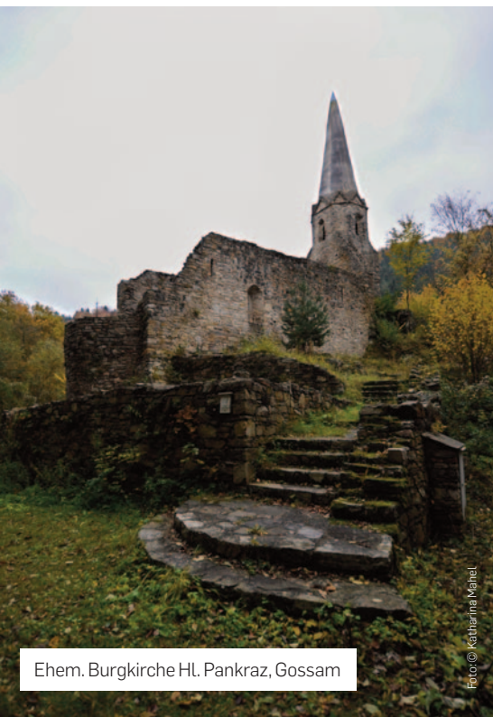
Ehem. Burgkirche Hl. Pankraz, Gossam