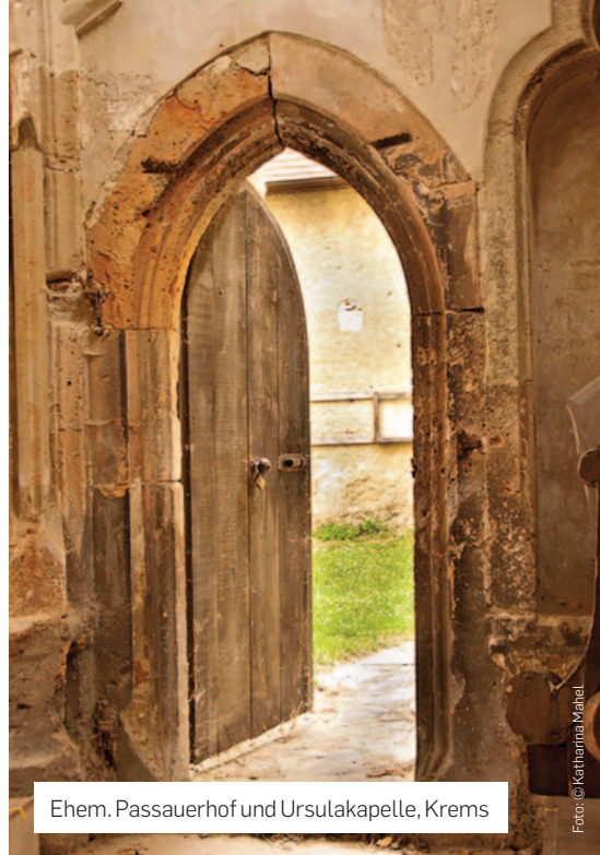
Ehem. Passauerhof und Ursulakapelle, Krems