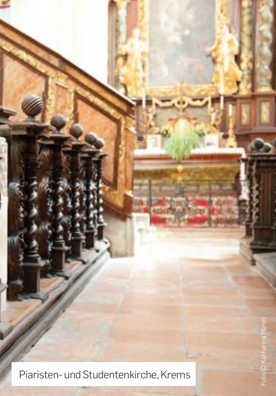
Piaristen- und Studentenkirche, Krems

Zur Messe am So um 8:30 Uhr geöffnet. Kirchen- und Burgführungen auf Anfrage in der Pfarrkanzlei St. Paul unter +43 2732 857 10