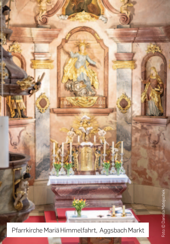
Pfarrkirche Mariä Himmelfahrt, Aggsbach Markt