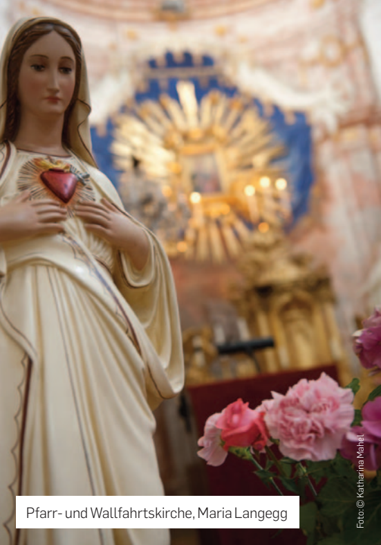
Pfarr- und Wallfahrtskirche, Maria Langegg