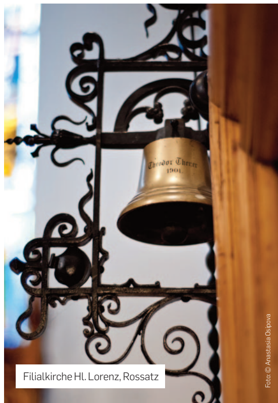
Filialkirche Hl. Lorenz, Rossatz