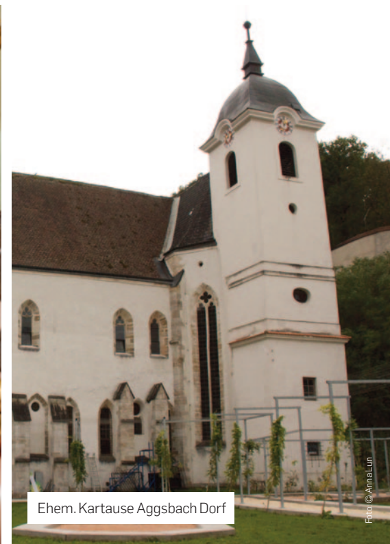
Ehem. Kartause Aggsbach Dorf