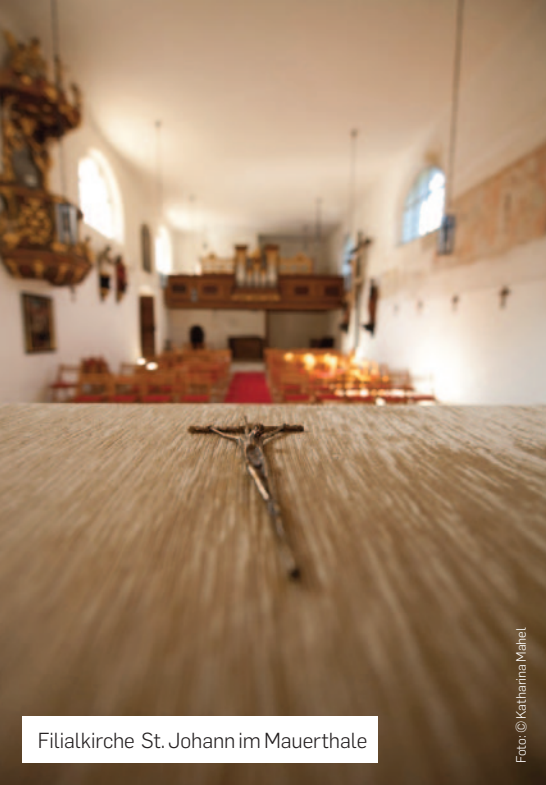
Filialkirche St. Johann im Mauerthale

Ganzjährig tagsüber von 8 bis 19 Uhr bzw. im Winter bis 17 Uhr geöffnet.