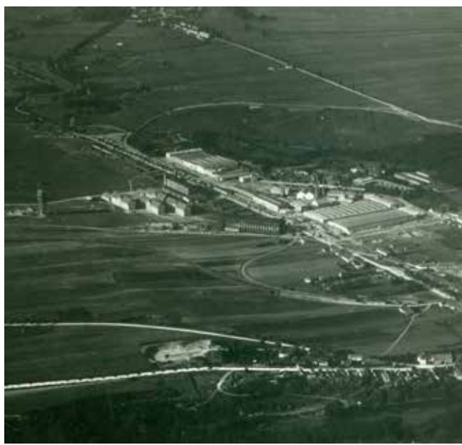
Gesamtüberblick von Fischamend mit Fliegerarsenal 1917